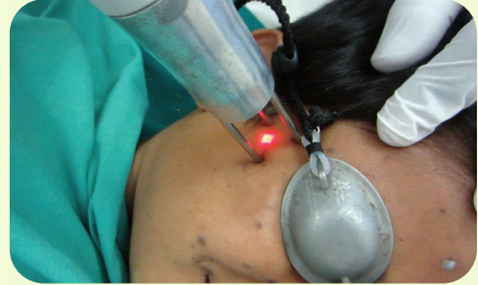
Naevus Treatment by Fractional CO2 Laser

जन्मजात दाग हरू जस्तै café-au-lait macules, lentiginos, freckles, nevus of ota, hori's nevus हटाउन Q switched ND:YAG laser प्रयोग गरिन्छ। Hemangioma, portwine stain, angiokeratoma जस्तो को उपचार गर्न Pulse Dye Laser को प्रयोग गरिन्छ । यो लेजर ४-६ हप्ता को interval मा गर्न गरिन्छ र लेजर को असर देख्न कमती मा ८-१० session लाग्न सक्छ ।