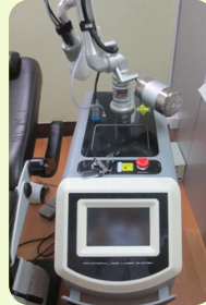
Fractional CO2 Laser