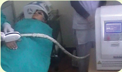
Burn Scar treatment by IPL(Intense Pulse Light)

कपाल हटाउन IPL(Intense Pulse Light) र Diode Laser को प्रयोग गर्ने गरिन्छ। Light therapy को प्रयोग गरेर permanent hair लाई जरा देखि नष्ट गर्ने गरिन्छ । यो therapy ४-६ हप्ता को interval मा गर्ने गरिन्छ र ८-१० session गरे पछि मात्र राम्रो result आउनेछ, बाक्लो कालो रौं (permanent hair) मा laser light ले बढी प्रभाव पार्छ भने मसिनो खैरो रौं र भुत्ला मा लेजर ले असर गर्दैन। Hormone बढेको कारण अथवा अन्य रोग को कारण पनि हुन सक्छ, त्यसैले यो therapy गर्नु पहिला Hormone जाँच गर्न अनिवार्य छ ।