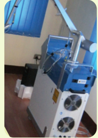
Q-Switched ND:YAG Laser